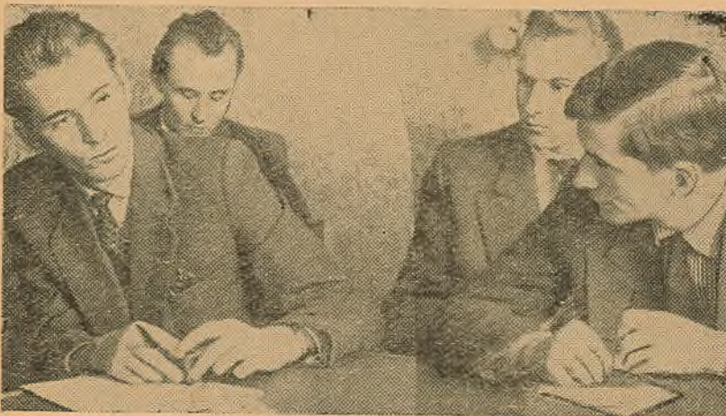
Польскія госці ў камітэце камсамола

Вырашыць задачу павышэння якасці падрыхтоўкі нельга аднабокова, толькі за лік узмацнення патрабавальнасці. Гэта неабходная мера, але спыняцца на ёй нельга. Паўсядзённае павышэнне патрабавальнасці павінна спалучацца з такой жа паўсядзённай, разнабаковай і удумлівай работай па ўзмацненню дапамогі студэнтам. Відавочна, што сюды ўваходзіць і планаванне, і арганізацыя экзаменацыйных сесій, павышэнне ідэйна-тэарэтычнага і метадычнага ўзроўня лекцый, практычных заняткаў і кансультацый і рэгулярнае забеспячэнне завочнікаў неабходнай літаратурай, праграмамі, падручнікамі і метадычнымі дапаможнікамі. Завочнае навучанне ва ўніверсітэце яшчэ не стала арганічнай часткай агульнай работы кафедраў, хаця некаторыя зрухі ў гэтай справе і ёсць. Кафедры ўсё яшчэ недастаткова ўдзельнічаюць у арганізацыі вучэбнага працэсу на завочным факультэце, недастаткова ажыццяўляюць кантроль за якасцю чытання лекцый, правядзення практычных і семінарскіх заняткаў. Большасць кафедраў на сваіх пасяджэннях не заслухоўваюць справаздачы выкладчыкаў аб рабоце са студэнтамі-завочнікамі, вельмі рэдка абмяркоўваюць пытанні, звязаныя з вучэбна-метадычнай работай, а таксама пытанні аб падрыхтоўцы і правядзенні вучэбна-экзаменацыйных