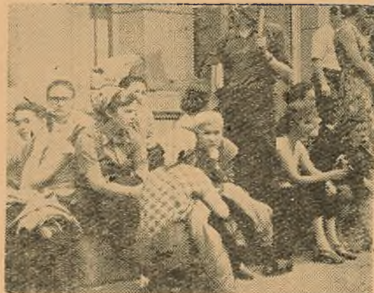
Па звычай, перад дарогай трэба прысесці...

Зараз большасць студэнтаў-біёлагаў выехалі на практыку на возера Нарач. А. ВІКЕНЦЬЕУ.