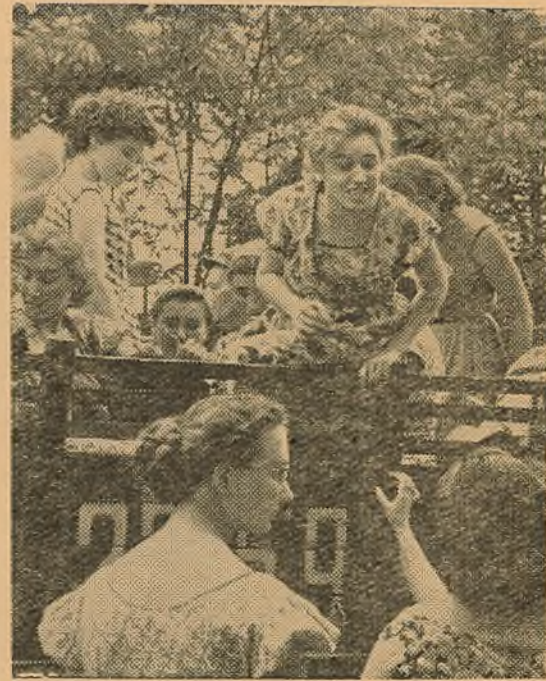
Гучаць апошнія словы развітання...